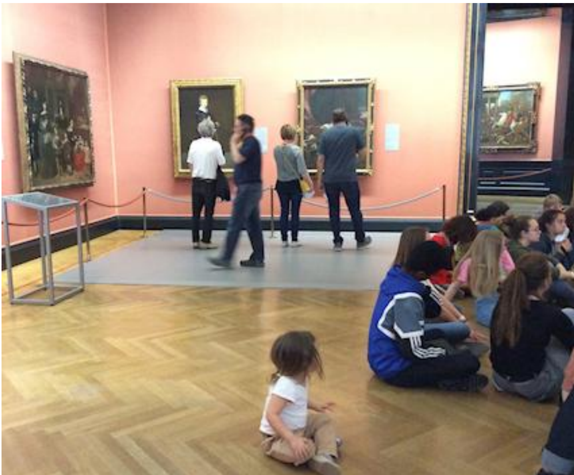
Au Kunsthistorisches Museum