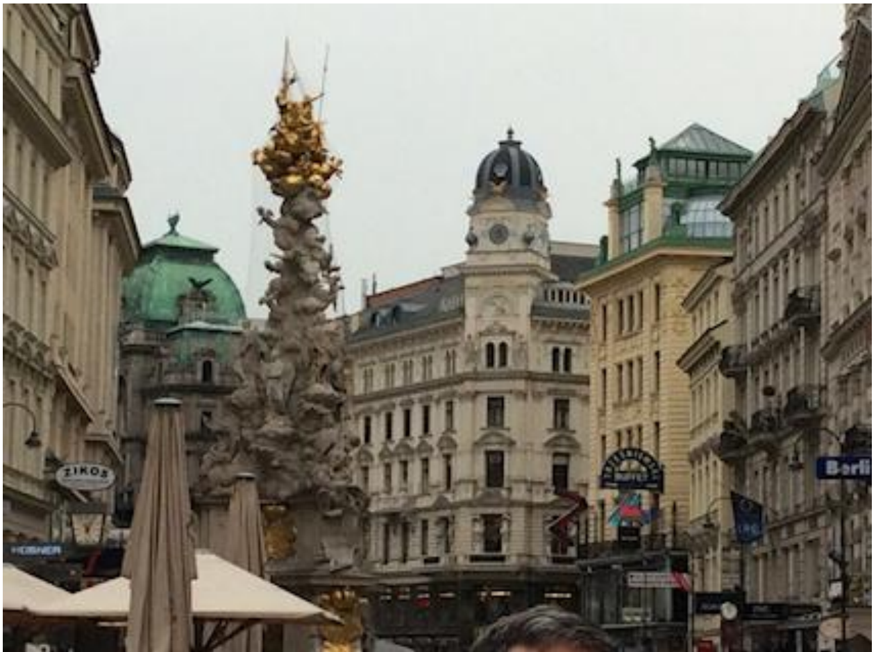
Vue de Vienne et de la "Pestsäule"