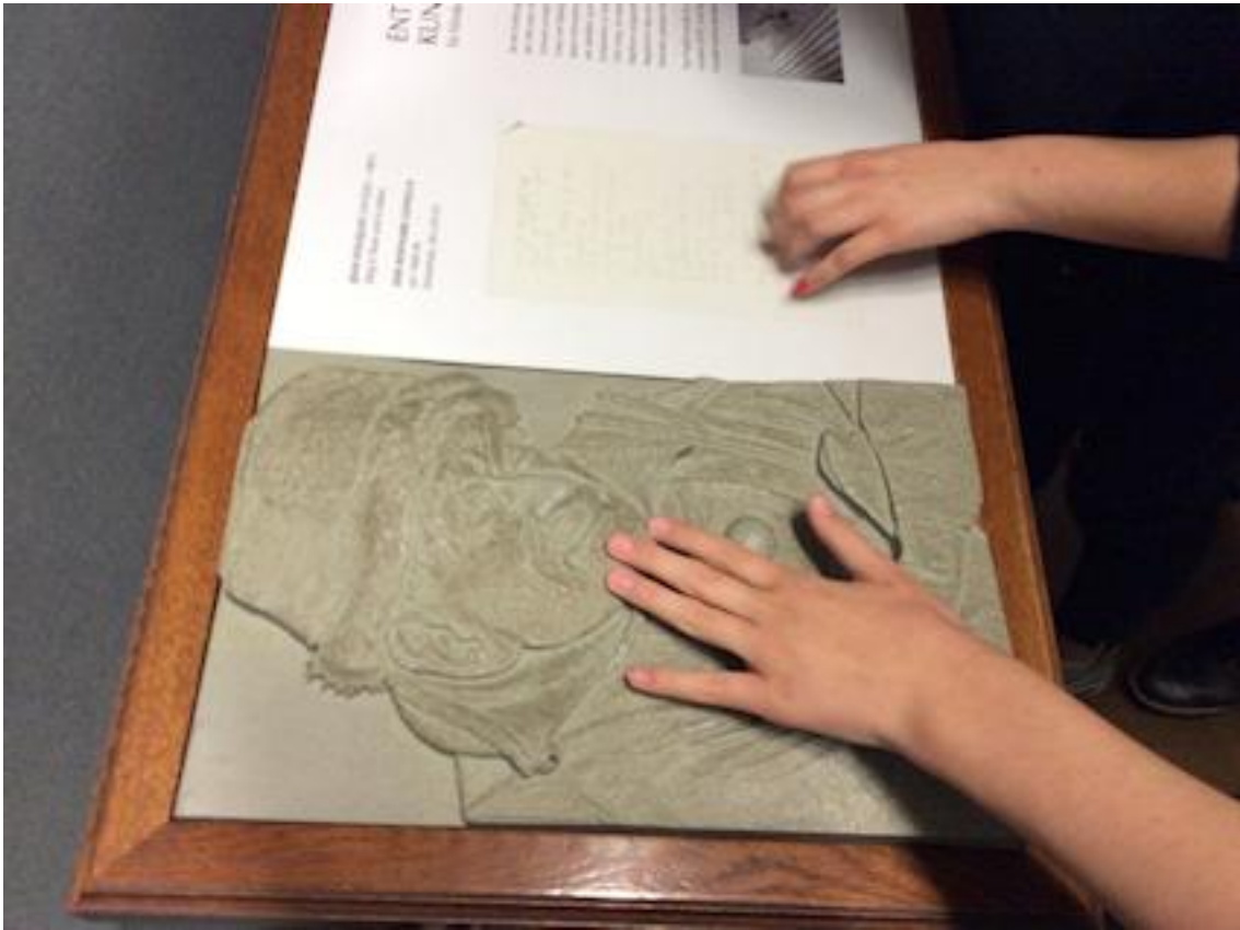
Au Kunsthistorisches Museum