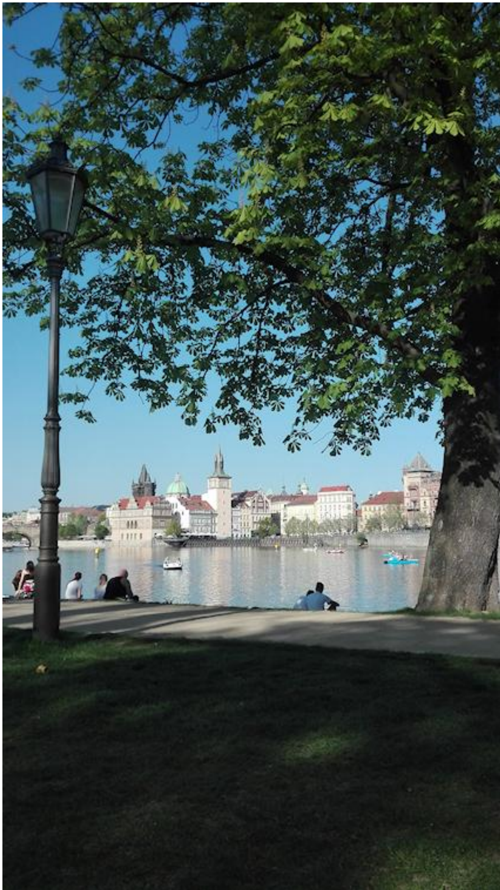
Prague, les bords de la Moldau