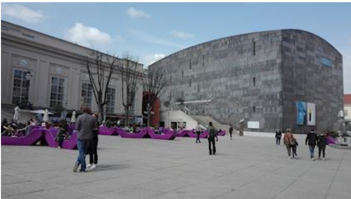
Le MUMOK (Musée d'Art moderne) à Vienne