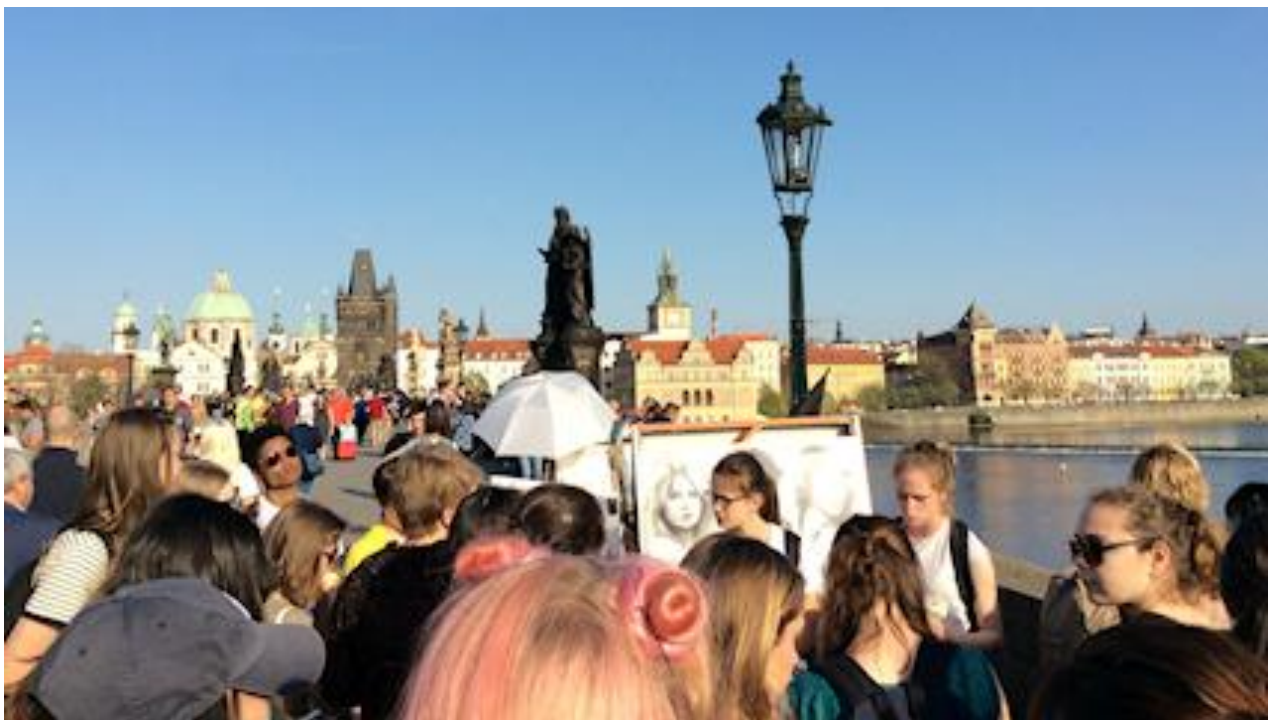
Prague, sur le pont Charles