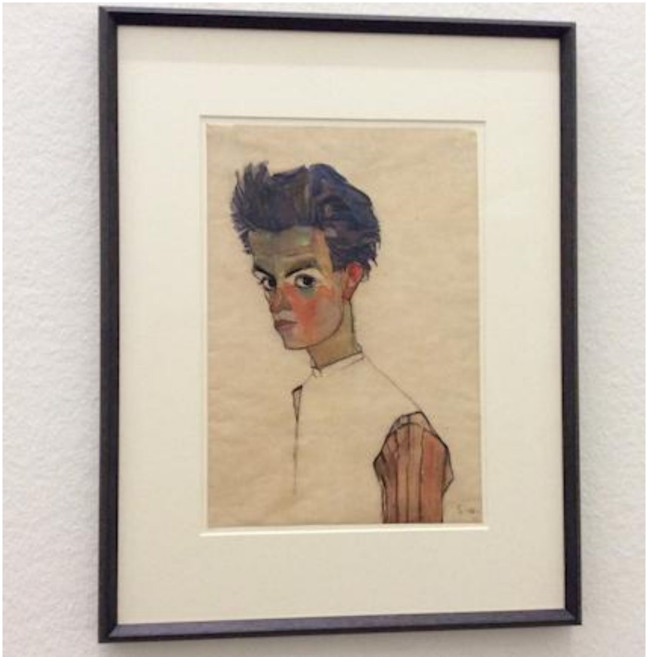
Exposition Egon Schiele au MUMOK